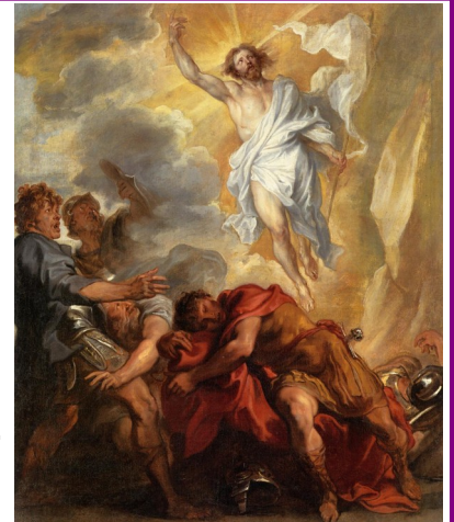
Van Dick - Resurrezione